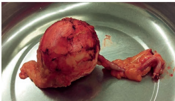
Figura 1. Pieza operatoria muestra quiste periapendicular.

fueron: vesícula de 15 x 7 cm pared engrosada, con múltiples litiasis y tumoración quística de 10 x 8 cm totalmente adherida a epiplón, peritoneo parietal, y al apéndice cecal (Figura 1). Se envía muestra (tumoración quística + apéndice cecal) a examen histopatológico, que concluyó como diagnóstico: quiste hidatídico variante racemosa y apendicitis catarral aguda (Figuras 2 y 3). Se indica tratamiento postquirúrgico de albendazol 400 mg c/12 h por 30 días. La paciente es dada de alta al tercer día de la cirugía sin complicaciones.