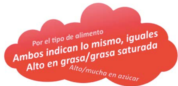
Figura 2. Razones mencionadas por la elección del producto etiquetado que les pareció más saludable.

y aquellos con niveles educativos más bajos. Esta podría ser la razón por la que los más jóvenes y las personas con menor educación podrían ser más susceptibles a percibir en mayor proporción el semáforo-GDA como más saludable.