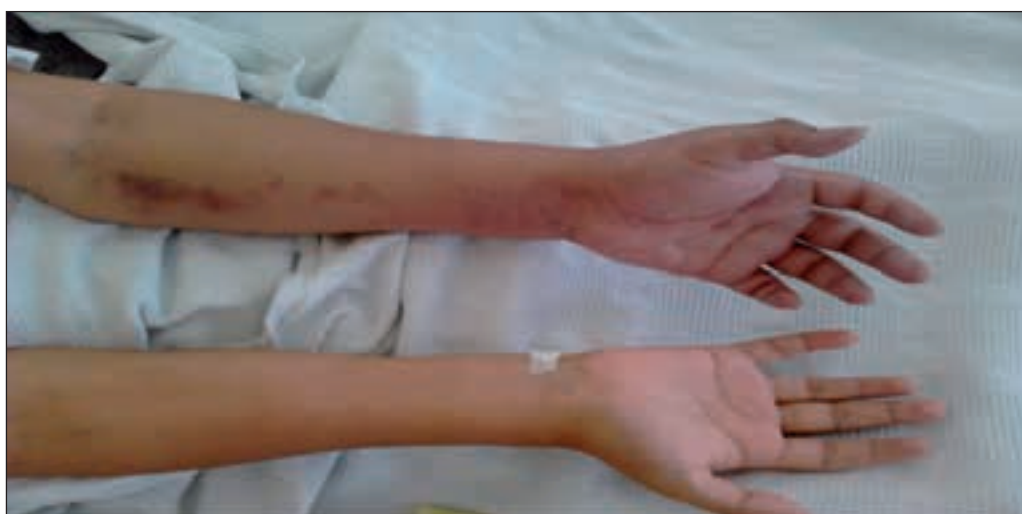
Figura 2. Edema del miembro superior izquierdo. Trombosis de la vena cefálica del brazo izquierdo.

18 respiraciones/min y presión arterial: 130/80 mmHg. Se dio el diagnóstico de enfermedad cerebro vascular (ECV) de tipo hemorrágico. Se solicitó tomografía cerebral (Figura 1) que mostró una zona hiperdensa en cisterna posterior. Se inició tratamiento con manitol, mejorando su estado clínico. En el hemograma se presentó una trombocitopenia severa (40 000 cel/mm 3 ) por lo que se indicó la transfusión de 4 unidades de plaquetas.