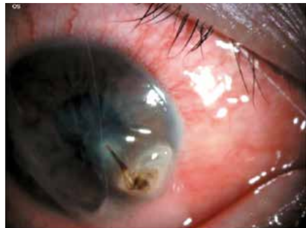
Figura 1. Córnea edematosa con presencia de cuerpo extraño.

Se presenta el caso de una paciente de 32 años de edad, natural y procedente de la zona rural del departamento de San Martín, que refiere antecedente de picadura de avispa hace 24 horas en ojo derecho, presentando al momento de la consulta disminución de la agudeza visual, enrojecimiento, lagrimeo, dolor, secreción; agudeza visual de cuenta dedos a 2 metros del ojo derecho y 20/25 ojo izquierdo, con presiones intraoculares de 12 y 13, respectivamente; a la biomicroscopía se encuentra hiperemia conjuntival con inyección periciliar 3+ y presencia de cuerpo extraño en la córnea que llega hasta el estroma con edema 3+, estrías en la Descemet del ojo derecho. Figura 1, 2 y 3.