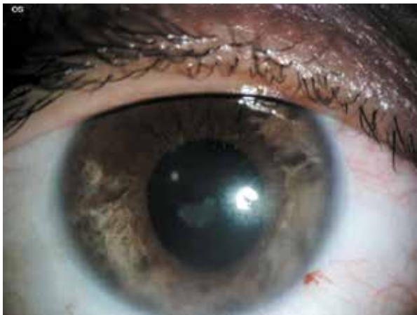
Figura 5. Atrofia iridiana a la semana 4.

Así mismo no todas las clases de avispa causan estos cambios oculares, por lo que sería materia de una investigación más profunda a posteriori.