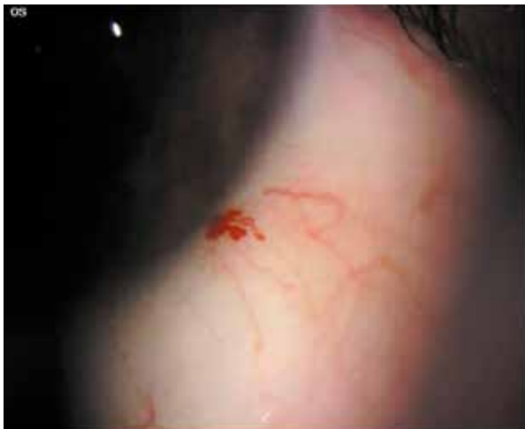
Figura 3. Dilatación vascular horas 4 perilimbar.