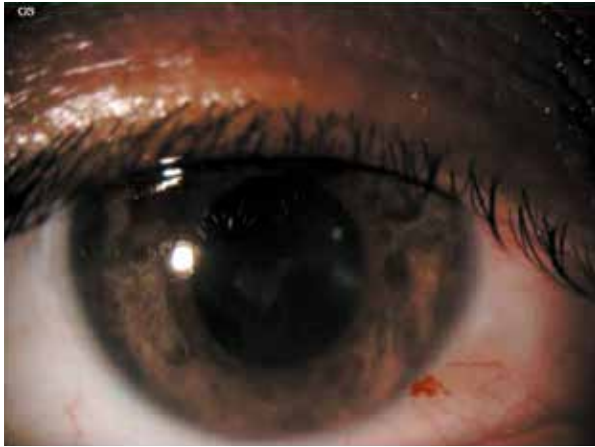
Figura 4. Atrofia iridiada a la semana 2