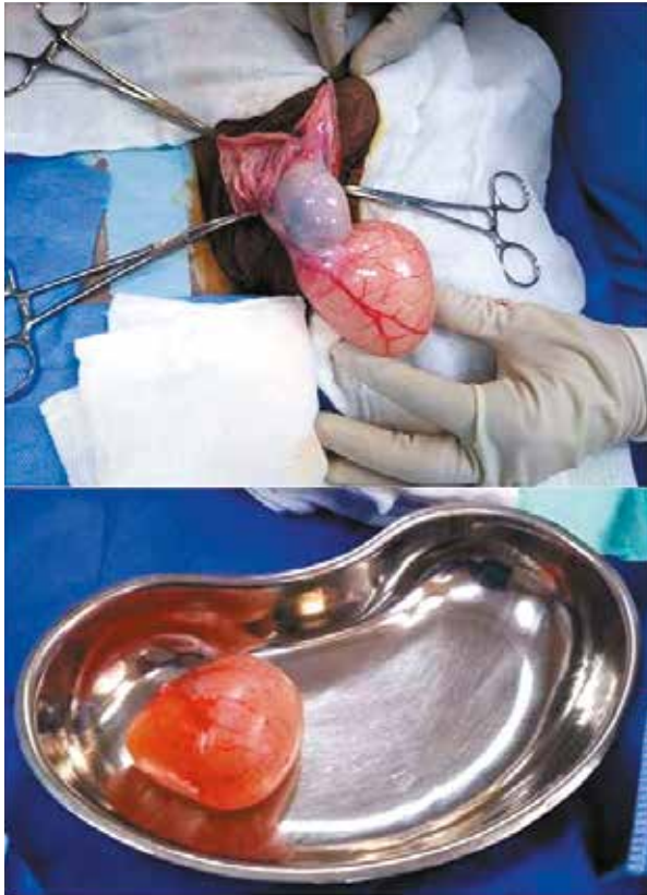
Imagen 1: Tumoración paratesticular derecha + testículo derecho (Superior) y Tumoración paratesticular (Inferior)

realizándose orquiectomía radical derecha. Paciente bajo efectos de anestesia, luego de asepsia y antisepsia de zona operatoria y colocación de campos estériles, se realiza incisión inguinal derecha. Luego disección por planos se llega al cordón espermiático, se realiza la liberación de adherencias de testículo y cordón, seguido de clampaje, sección y ligadura de cordón espermiático. Se obtiene la pieza operatoria (Imagen 1) constituida por: testículo derecho, epidídimo derecho y tumoración paratesticular derecha. Después de la revisión de