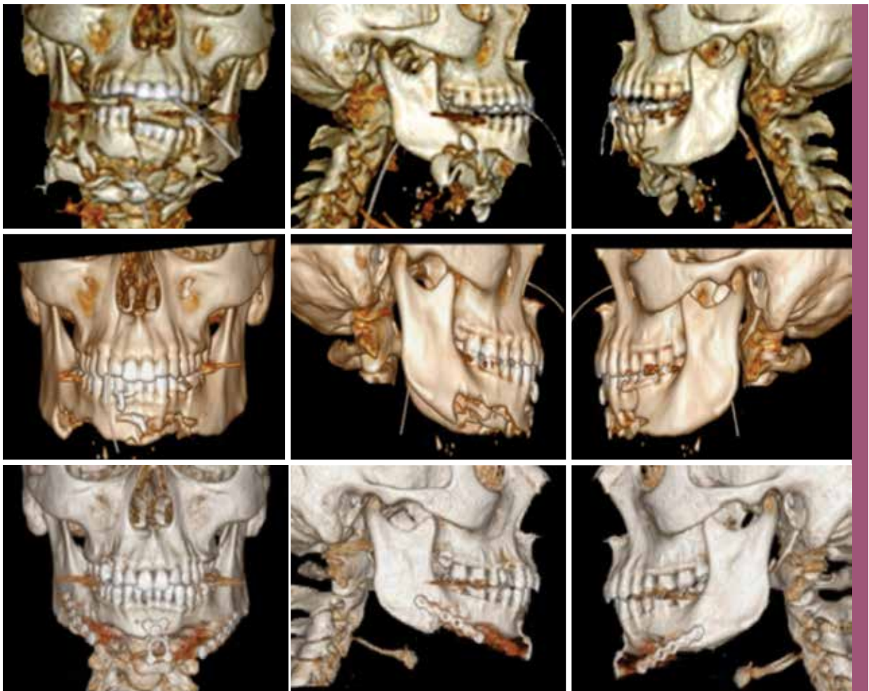
Figura 1. Arriba: tomografía del macizo facial al ingreso del paciente por emergencia. Al medio: tomografía después de la limpieza quirúrgica, reducción cruenta y osteosíntesis con alambre quirúrgico. Abajo: tomografía después de la colocación del implante y osteosíntesis respectiva.

Un paciente varón de 21 años de edad ingresa a emergencia por sufrir un traumatismo causado por arma de fuego de alta velocidad. El traumatismo compromete partes blandas y estructuras óseas del tercio inferior facial, la región submentoniana y ambas espacios submandibulares. El paciente